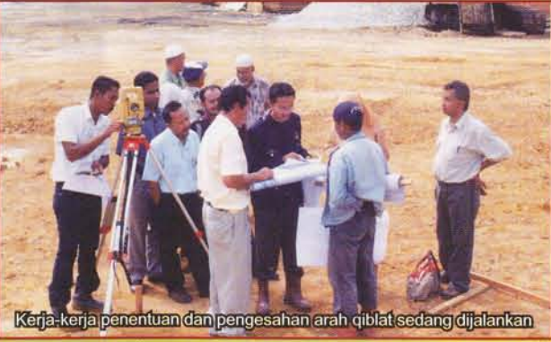
Kerja-kerja penentuan dan pengesahan arah qiblat sedang dijalankan

Pihak kontraktor perlu melantik juruukur berlesen ( surveyor ) untuk membuat kerja-kerja trabas ukur sama ada melalui batu sempadan atau cerapan matahari. Maklumat yang diperolehi hendaklah direkodkan.